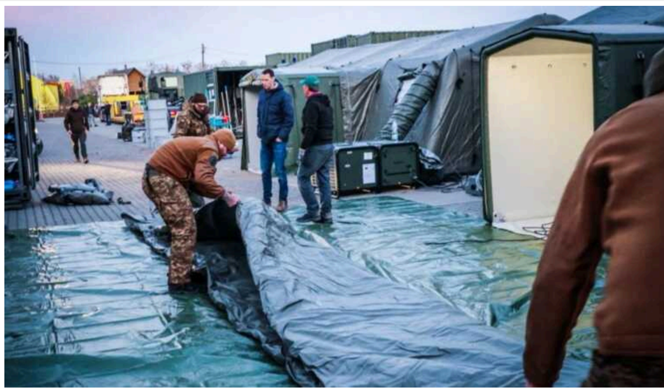
Нацгвардія України отримала від Нідерландів польові шпитали

Національна гвардія України повідомила, що вже використовує сучасні польові шпитали, отримані від Нідерландів.