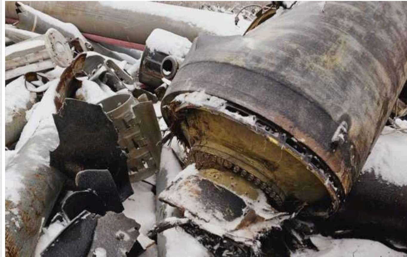
2 січня окупанти випустили по Харкову північнокорейську ракету, – прокуратура

Російські війська при завданні ударів по Харкову в минулий вівторок, 2 січня, використали ракету, отриману з Північної Кореї. Відповідні докази сьогодні, 6 січня, надала прокуратура Харківської області.