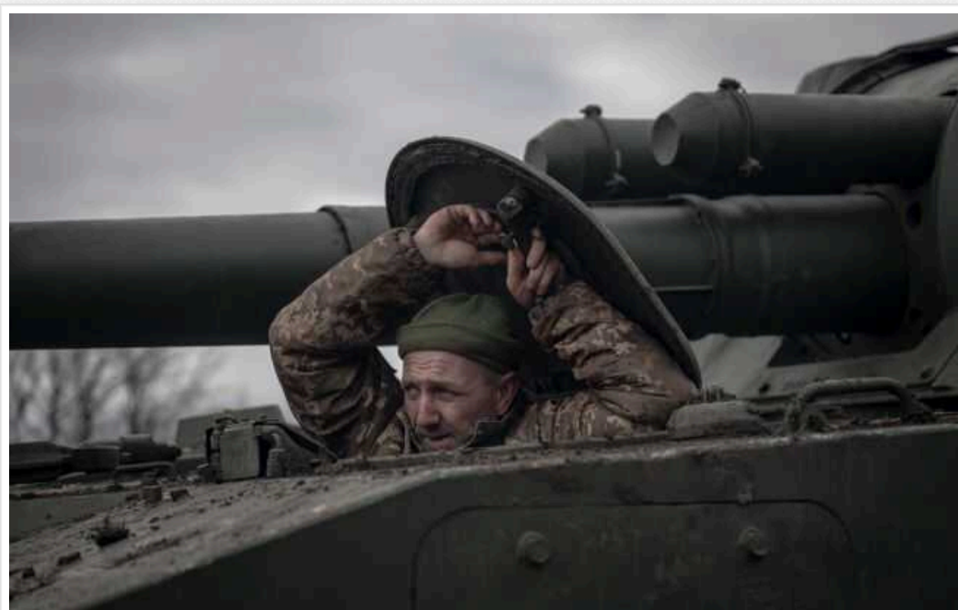
В ЗСУ відреагували на прогнози Інституту вивчення війни стосовно Куп'янського напрямку

Військові Російської Федерації з жовтня намагаються штурмувати Куп'янський напрямок, однак марно.