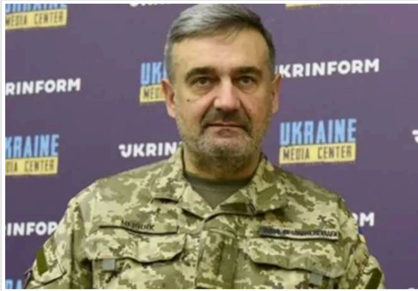
У ГУР прокоментували "вибухові" спецоперації в окупованому Криму: "Частина ширшого плану"

Спецоперації в Криму є частиною ширшого плану та єдиного задуму. Атаки на об'єкти окупантів на захопленому півострові нагадують загарбникам, що вони тимчасово на українській території, а також підбадьорюють українців в окупації, які продовжують вірити в перемогу над агресором.