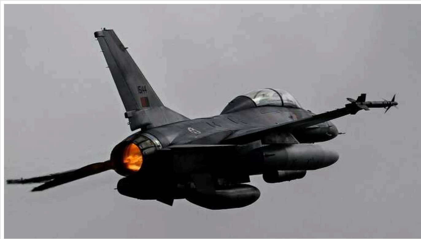
Поставка Україні винищувачів F-16 з Данії затримується на півроку, – ЗМІ

Данське видання Berlingske , з посиланням на Міністерство оборони країни, повідомляє, що поставка Данією винищувачів F-16 Україні відкладається на півроку.