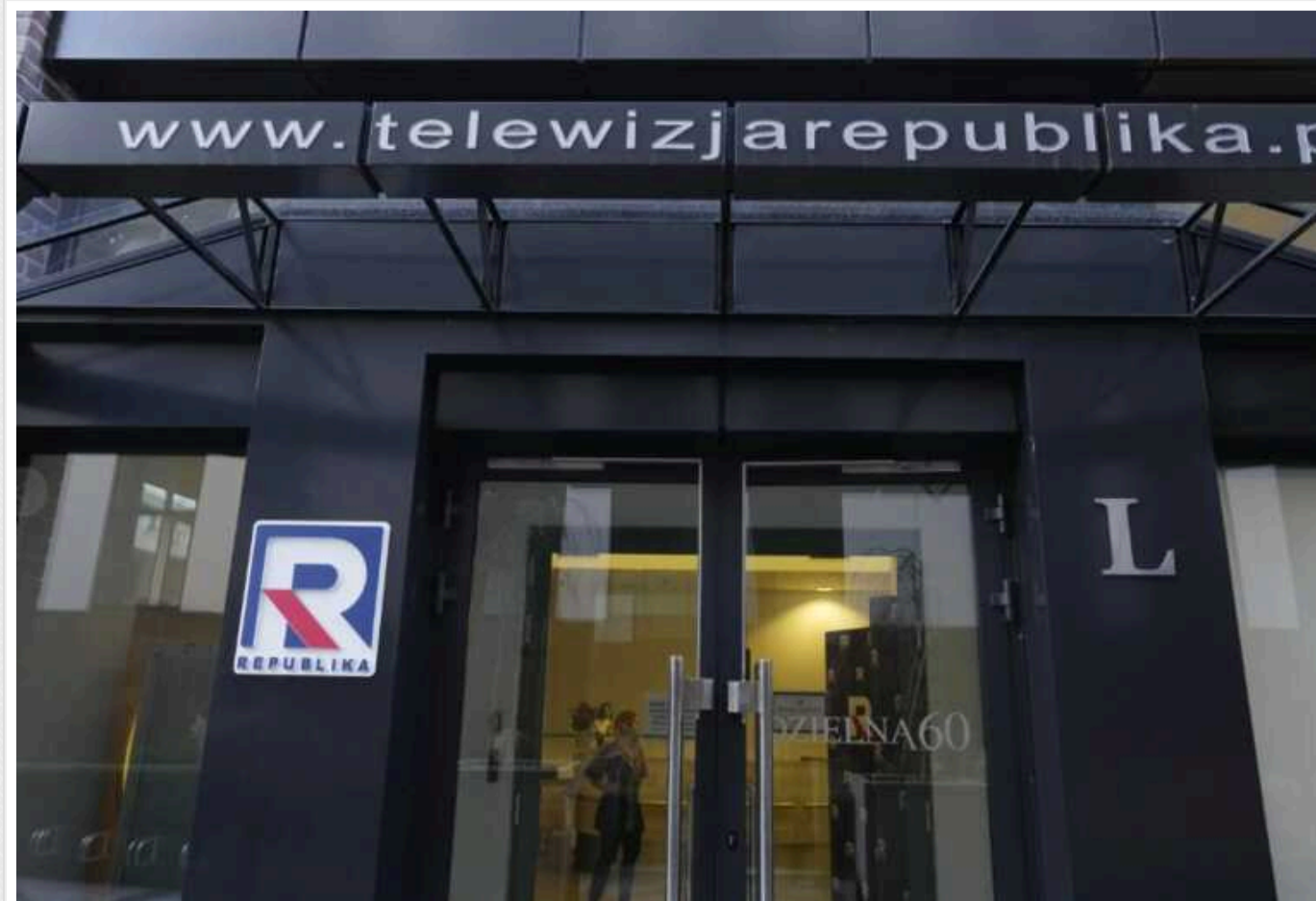
Польський телеканал зазнав критики після закликів чипувати мігрантів

Польська прокуратура почала перевірку після того, як в етері приватного консервативного телеканалу TV Republika заявили, що мігрантів слід відправляти до Освенцима чи що їх потрібно татуювати або чипувати.