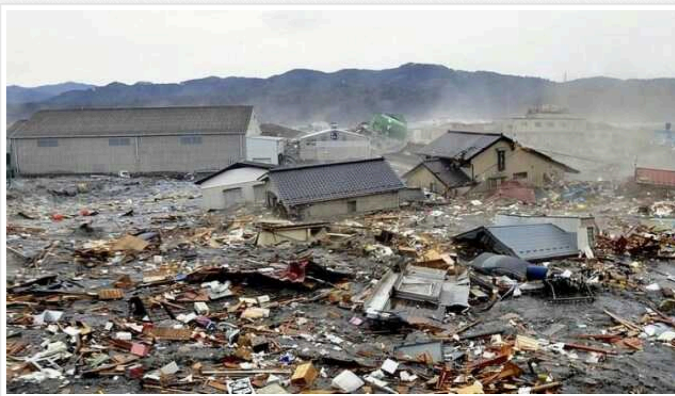
Землетрус у Японії: кількість жертв зросла до 126

Кількість загиблих через землетрус у Японії зросла до 126 осіб, понад 200 людей досі вважаються зниклими безвісти.