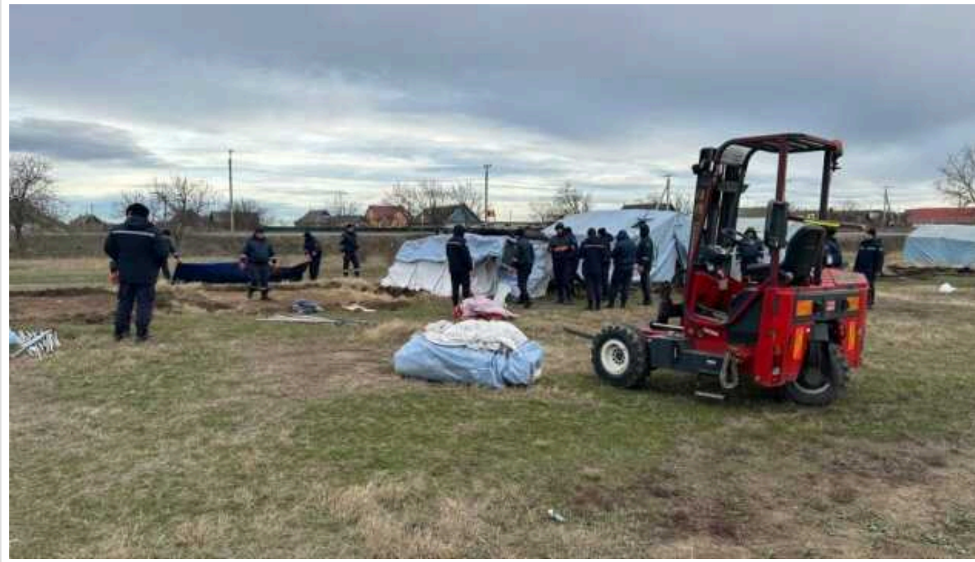
У Молдові закрили центр для прийому біженців з України

У Молдові цього тижня припинив роботу тимчасовий центр кризового реагування у селі Паланка на сході країни, де розміщували біженців з України.