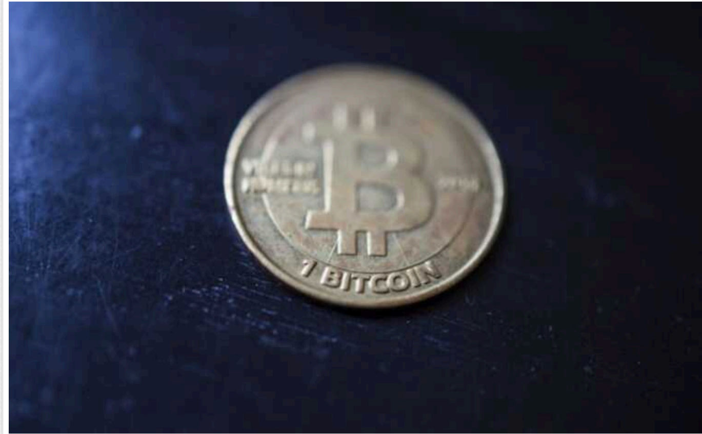
Reuters: У січні США можуть схвалити створення перших Bitcoin ETF

Компанії з управління інвестиціями, фондові біржі і Комісія з цінних паперів і бірж США обговорили зміни в формулюваннях заявок для спотових біткойн-ETF (Біржових інвестиційних фондів), що може призвести до того, що ці фонди вперше отримають схвалення в США.