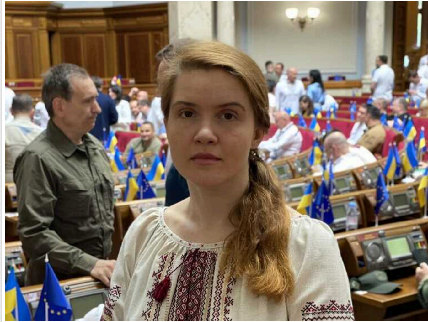
У Верховну Раду внесли постанову про зняття Безуглої з посади заступника голови оборонного комітету

У Верховну Раду України внесли постанову про відкликання нардепа Мар'яни Безуглої з посади заступниці голови Комітету з питань національної безпеки, оборони та розвідки.