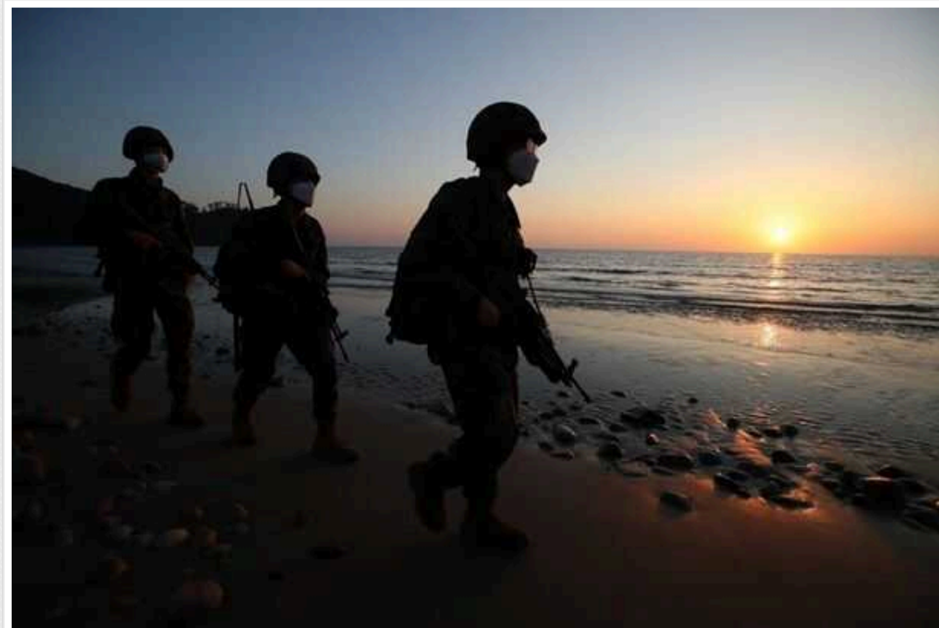
КНДР знову обстріляла узбережжя Південної Кореї, випустивши 60 снарядів, – Yonhap

Північна Корея другий день поспіль ескалує ситуацію зі своїм сусідом.