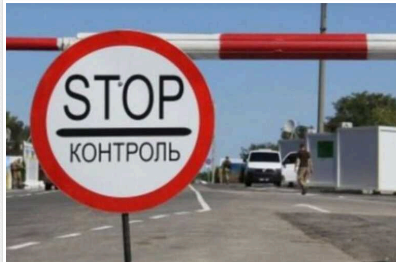
На Закарпатті ТЦК забрав чоловіка просто на блокпості, – нардеп ВР Мазурашу

З його слів, військові силою витягли чоловіка з автомобіля, тоді як дружина з дитиною залишилися на трасі.