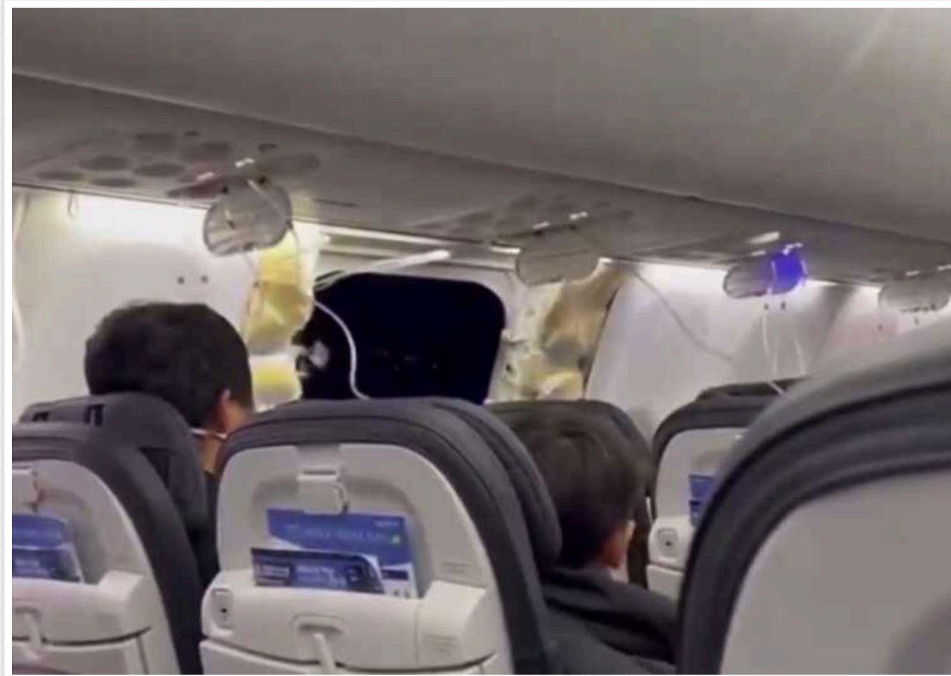
У США у пасажирського літака під час польоту вирвався шматок фюзеляжу

Борт летів з Портленда в Онтаріо, але через 30 хв на висоті 5 000 м шматок фюзеляжу та ілюмінатор відвалилися, а в салоні утворилася величезна дірка.