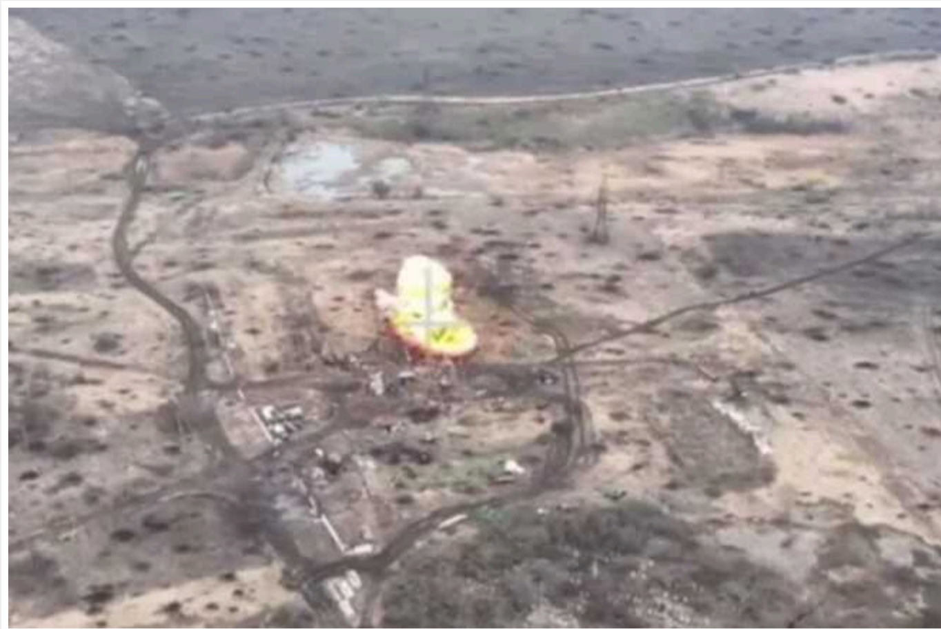
Залужний показав, як захисники нищать ворога за допомогою американської M777: "Що менше на нашій землі ворогів, то ближче перемога"

Головнокомандувач Збройних сил України Валерій Залужний показав кадри роботи бійців 45-ї окремої артилерійської бригади. За допомогою американської гаубиці M777 вони нищать ворога за будь-яких умов і в будь-яку погоду, щоб наблизити перемогу.