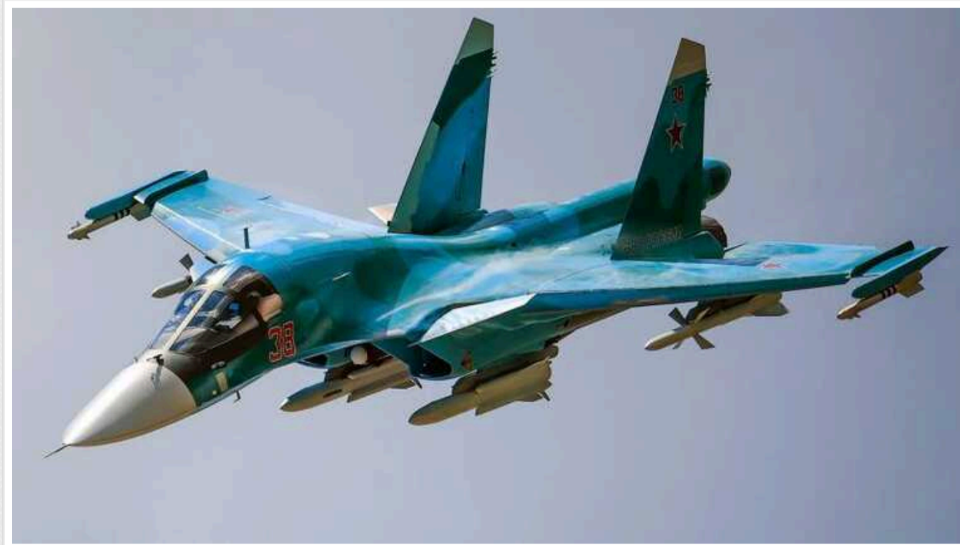
Розвідка Британії оцінила можливості авіації РФ після збиття Су-34

Раніше російська тактична авіація відігравала ключову роль на півдні України, зокрема, під час атак на український плацдарм на східному березі Дніпра. Проте збиття російських військових літаків унеможливило наступальні дії росіян на цьому напрямку.