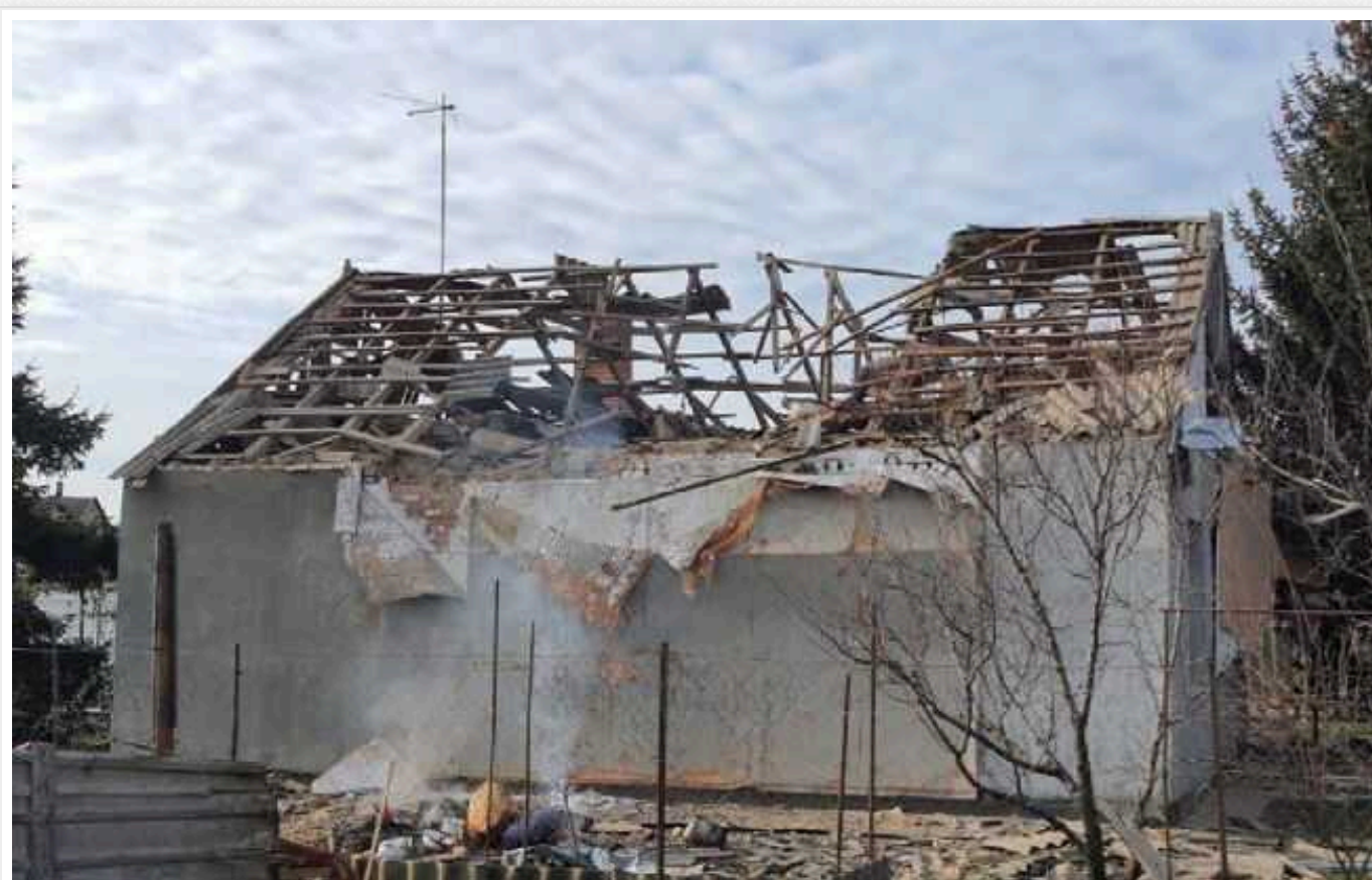
Окупанти вдарили по Нікополю: є жертва, постраждала дитина та пенсіонер

Російські окупанти вдарили з артилерії по Нікополю. Внаслідок атаки ворога загинула людина, двоє осіб поранені.