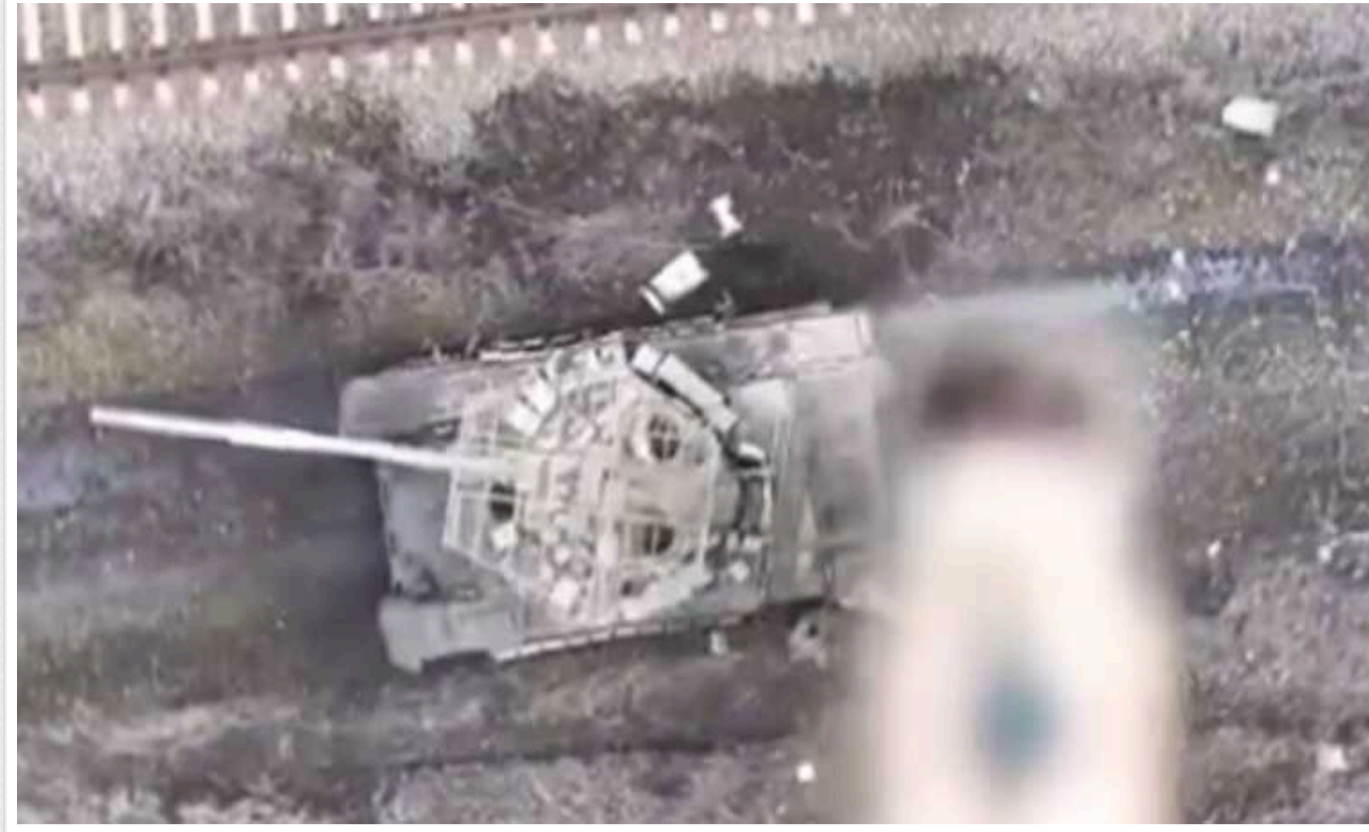
ЗСУ за допомогою дронів добивають два ворожі танки Т-72Б3М на Авдіївському напрямку

Бійці 47-ї ОМБр "Магура" добили за допомогою дронів два ворожі танки, які були покинуті поблизу залізниці на схід від села Степове поряд з Авдіївою.