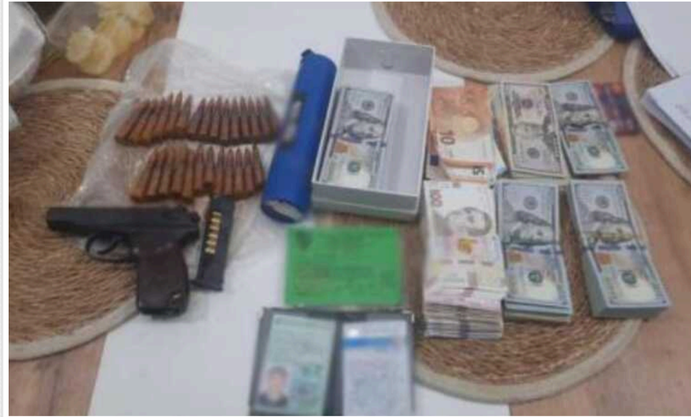
Поліція пов'язала банду кримінального "авторитету", яка тероризувала Коростень