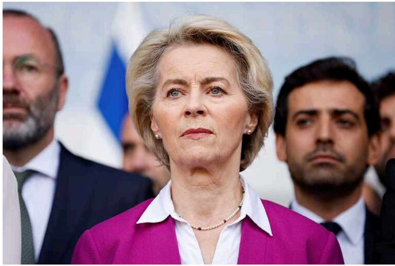
Єврокомісія готує для України альтернативний пакет допомоги

Європейська комісія працює над рішеннями, щоб допомогти Україні, якщо не вдасться дійти згоди між всіма 27 країнами ЄС щодо запропонованого пакету фінансування у розмірі 55 мільярдів євро.