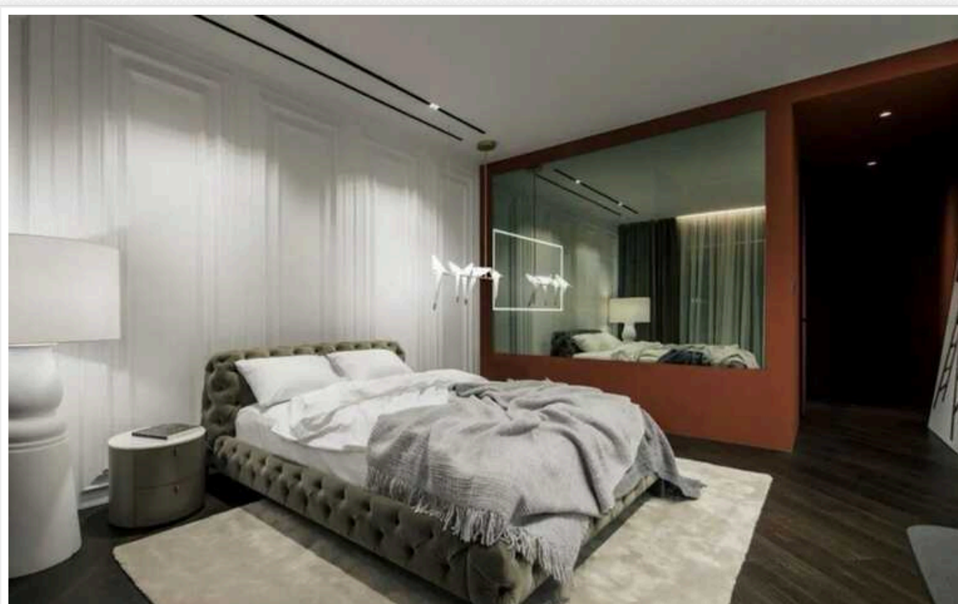
У "найдорожчому" будинку Києва продають 4-кімнатну квартиру за мільйони доларів

У Києві продають 4-кімнатну квартиру за 4,5 млн доларів. В ній виконано дорогий дизайнерський ремонт, а розташоване житло, як запевняє автор оголошення, у найдорожчому будинку столиці.