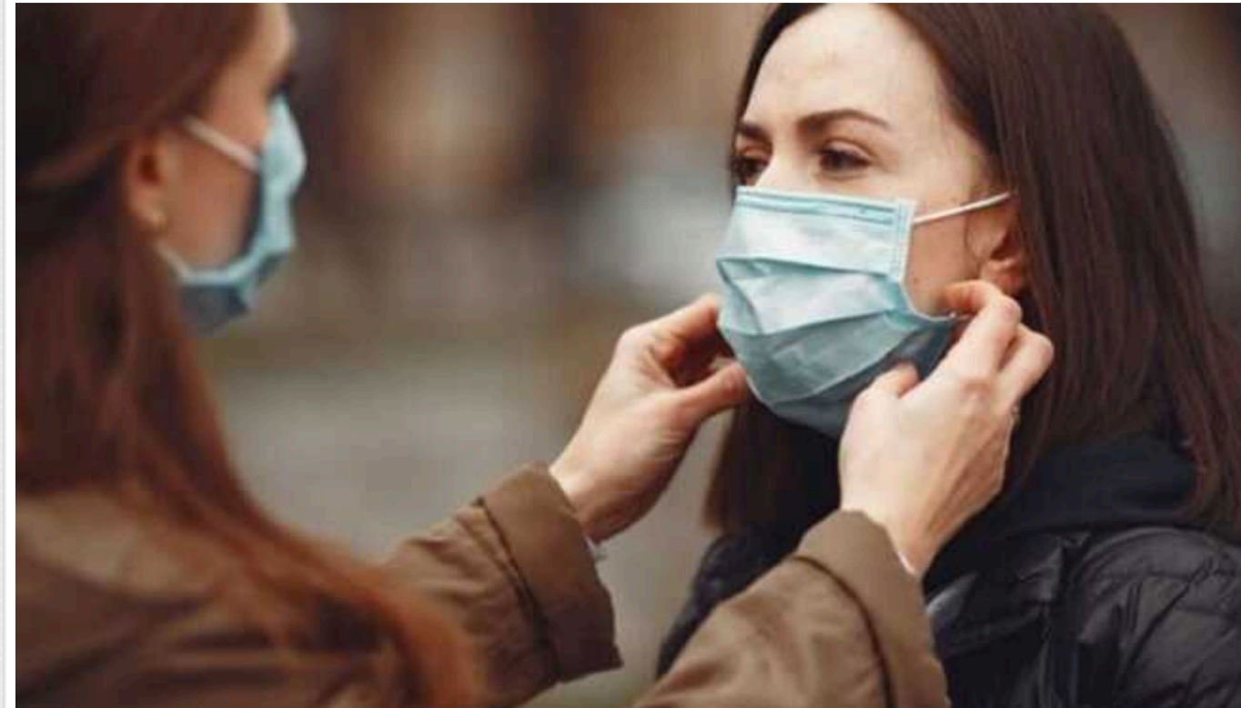
В Іспанії повертають масковий режим через спалахи COVID-19 та грипу

В Іспанії у період різдвяних свят різко збільшилася кількість випадків захворювання на коронавірусну хворобу COVID-19, а також грип. Через це кілька регіонів країни оголосили про поновлення деяких карантинних правил.