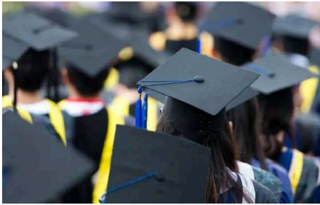
Кабмін планує скасувати бюджетні місця в українських вишах

В Україні планують практично повністю скоротити бюджетні місця. Замість цього студенти отримуватимуть гранти і самі будуть вирішувати: на які спеціальності витратити кошти, які держава надала для навчання.