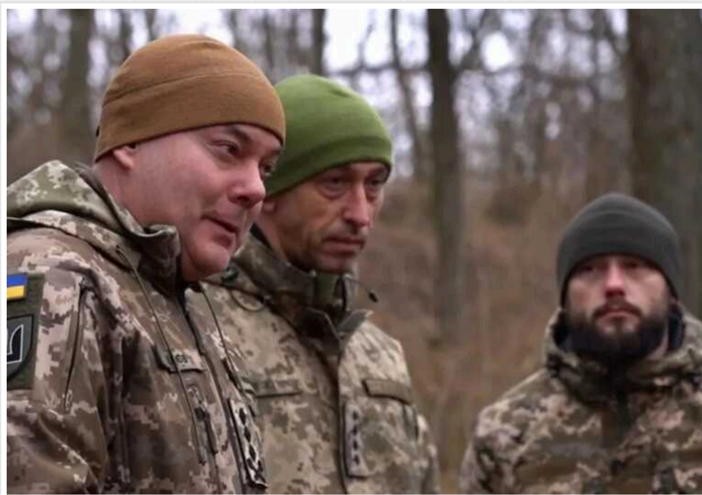
Наєв відвідав опорний пункт на Київщині на Хрещення і розповів про забезпечення військових

Командувач Об'єднаних сил Збройних сил України Сергій Наєв у день Хрещення Господнього, 6 січня, відвідав один з опорних пунктів підрозділу, який виконує бойові завдання на Київщині. Зокрема, він ознайомився зі станом боєготовності та тилового забезпечення.