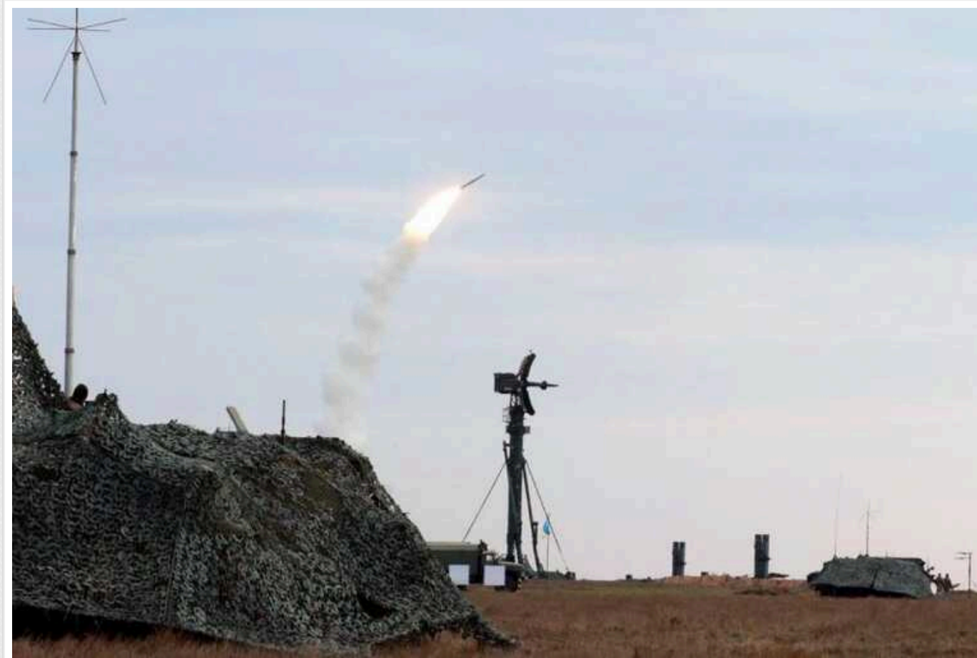
Запаси ракет швидко виснажуються: перевага США опинилася під загрозою, – Bloomberg

Найочевидніша слабкість США полягає у політичній поляризації. Продовження підтримки України у війні перетворилось у партійне протистояння. Однак в США спостерігають не лише політичні проблеми. Військове домінування також знаходиться під питанням, пише Bloomberg.