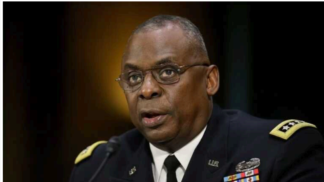
Міністр оборони США Ллойд Остін опинився у лікарні; потрапив з ускладненнями після нещодавньої планової медичної процедури

Як зазначили журналісти, в Міноборони США зберігали мовчання протягом чотирьох днів, перш ніж оголосити про госпіталізацію міністра. Асоціація преси Пентагону висловила з цього приводу своє "обурення".