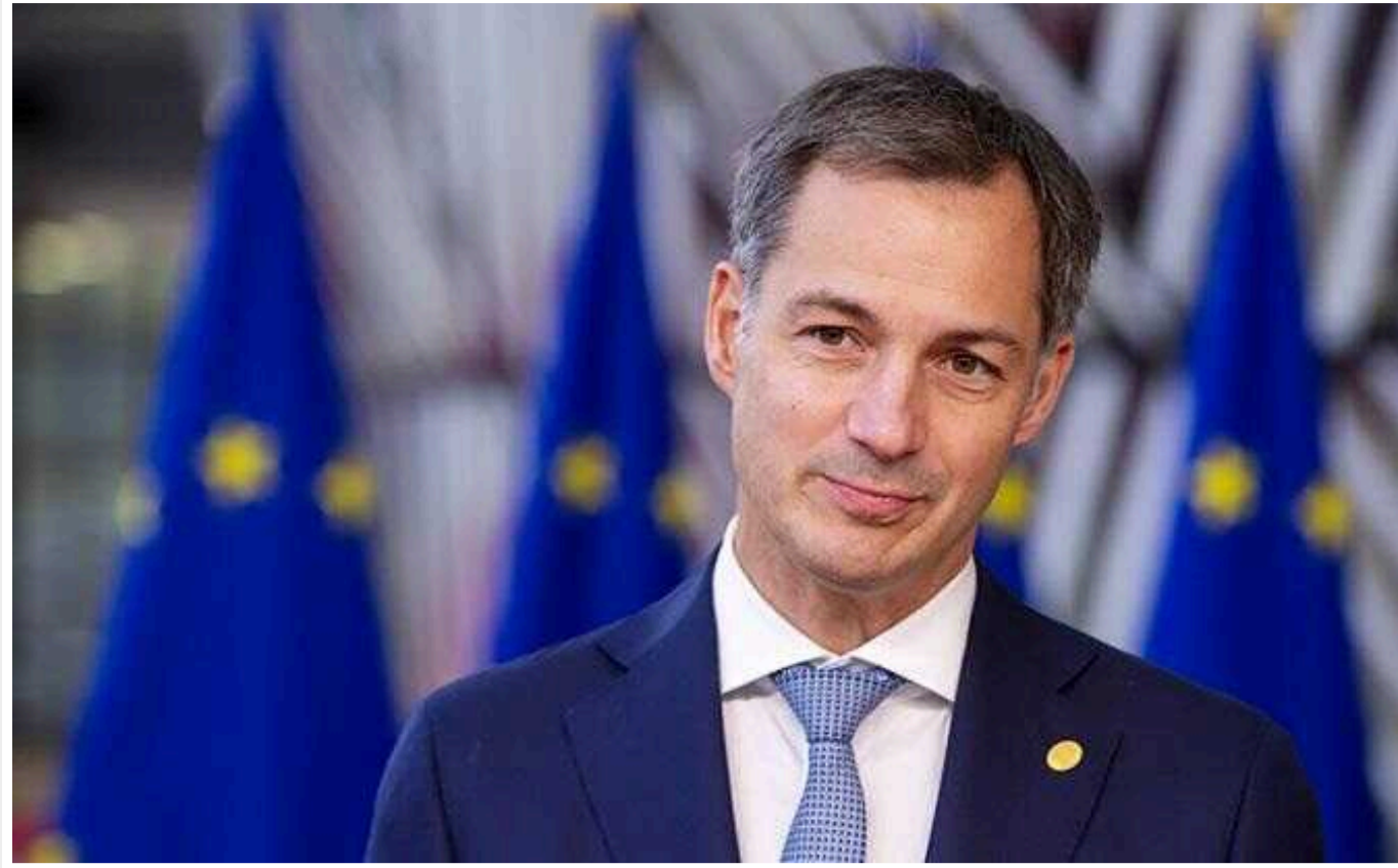
Бельгія назвала підтримку України пріоритетом під час головування в ЄС

Учора, 5 січня, Бельгія офіційно розпочала головування в Європейському союзі. Підтримка України – пріоритет країни.