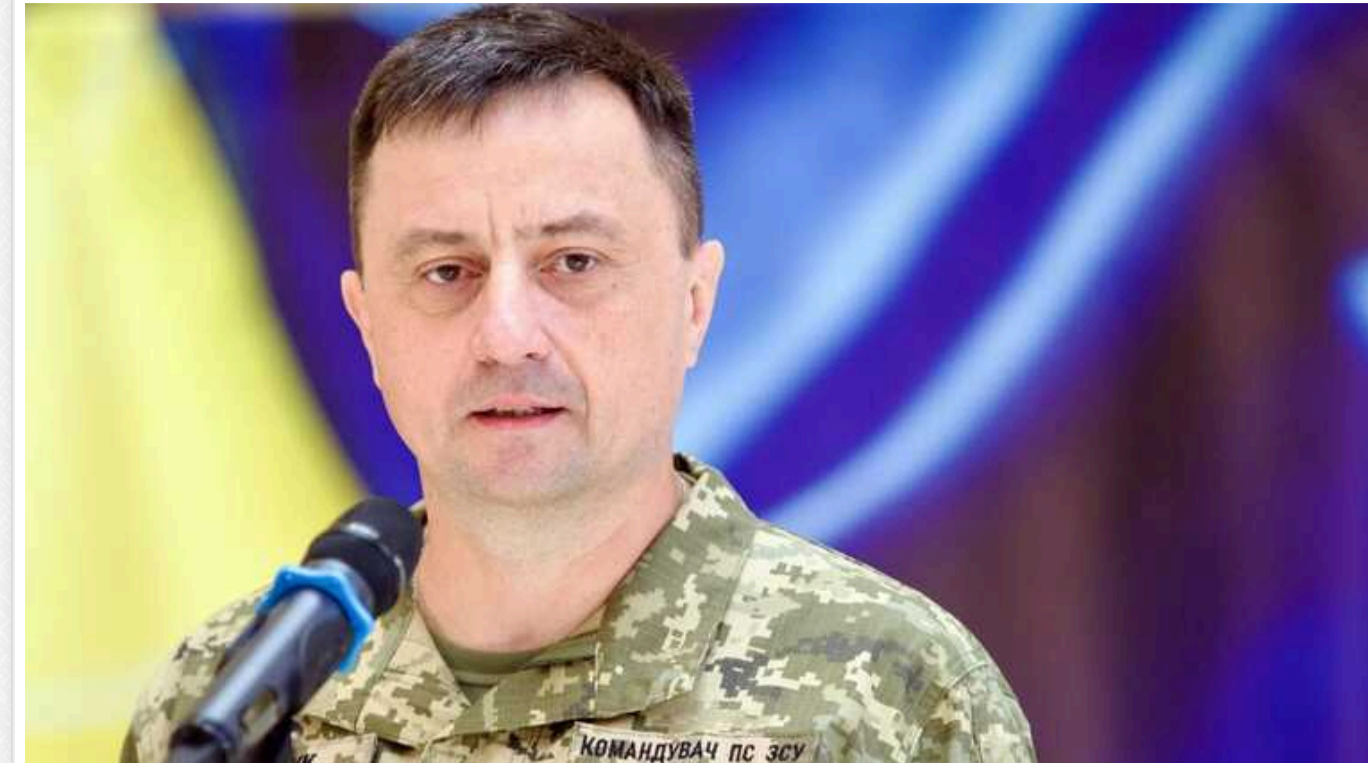
Повітряні сили знищили ще один пункт управління у Криму: під ударом аеродром Саки

Повітряні сили ЗСУ вразили аеродром Саки на території окупованого Криму. Там був ще один пункт управління ворога.