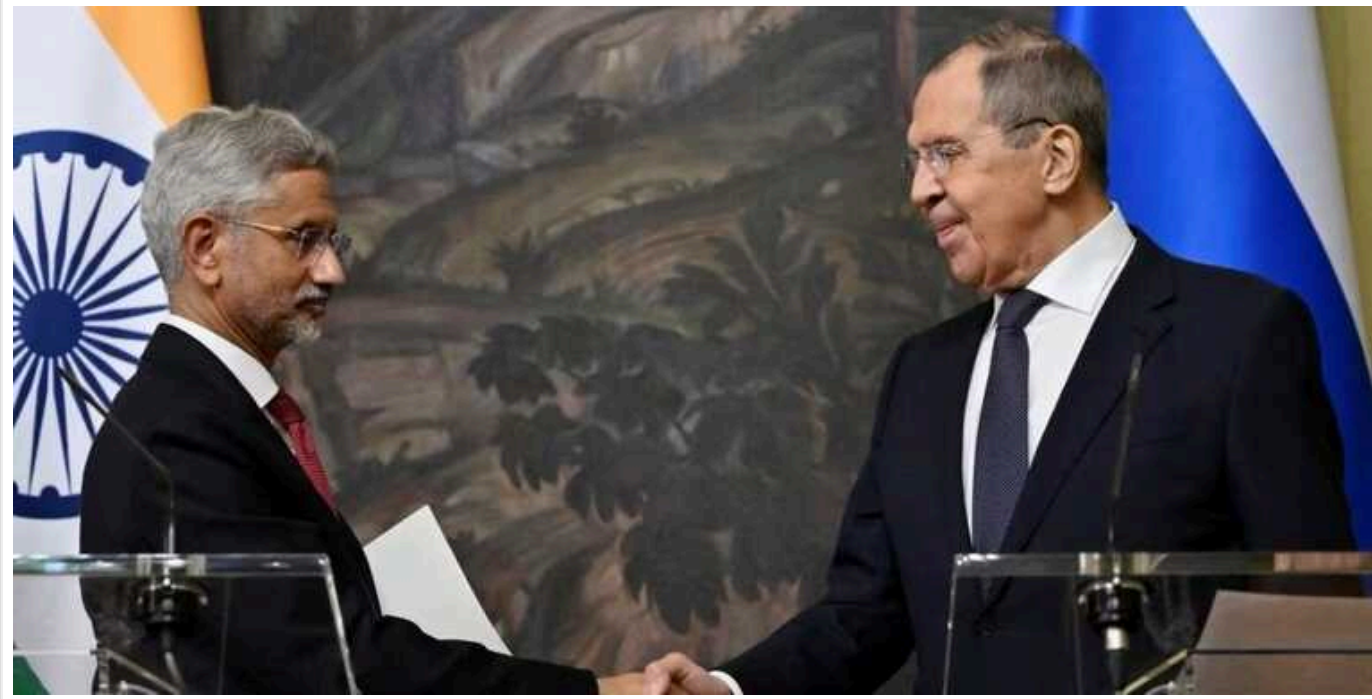
РФ боїться погіршення відносин з Індією, - ISW

Російські ЗМІ намагаються не допустити погіршення відносин між Росією та Індією через повідомлення про те, що країни Заходу нібито цілеспрямовано постачають в Україну артилерійські боєприпаси індійського виробництва.