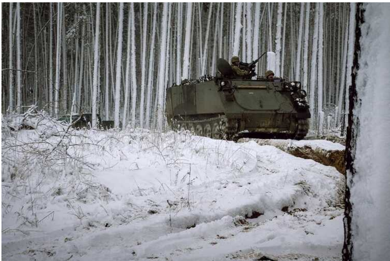
Ситуація на фронті: ЗСУ відбили ворожі атаки в районі Синьківки на Харківщині і Мар'їнки на Донеччині

Російська окупаційна армія продовжує застосовувати властиву собі тактику терору та обстрілює численні цивільні об'єкти нашої держави. Ворог завдає ракетних та авіаційних ударів, а також здійснює обстріли з реактивних систем залпового вогню.