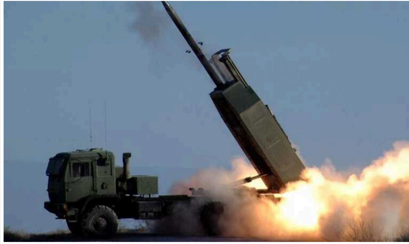
Бійці ССО скоригували знищення двох ворожих САУ "Нона-С" ударом HIMARS

На Запорізькому напрямку знищено дві ворожі САУ "Нона-С".