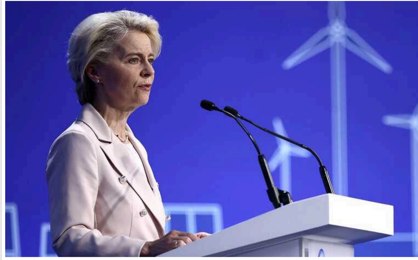
Єврокомісія хоче згоди всіх країн ЄС щодо коштів для України, але готує альтернативи

Президент Європейської комісії Урсула фон дер Ляєн назвала основним пріоритетом узгодження всіма 27 країнами-членами Європейського союзу рішення про створення Українського фонду. Однак готується запасний варіант у разі відсутності консенсусу у блоці.