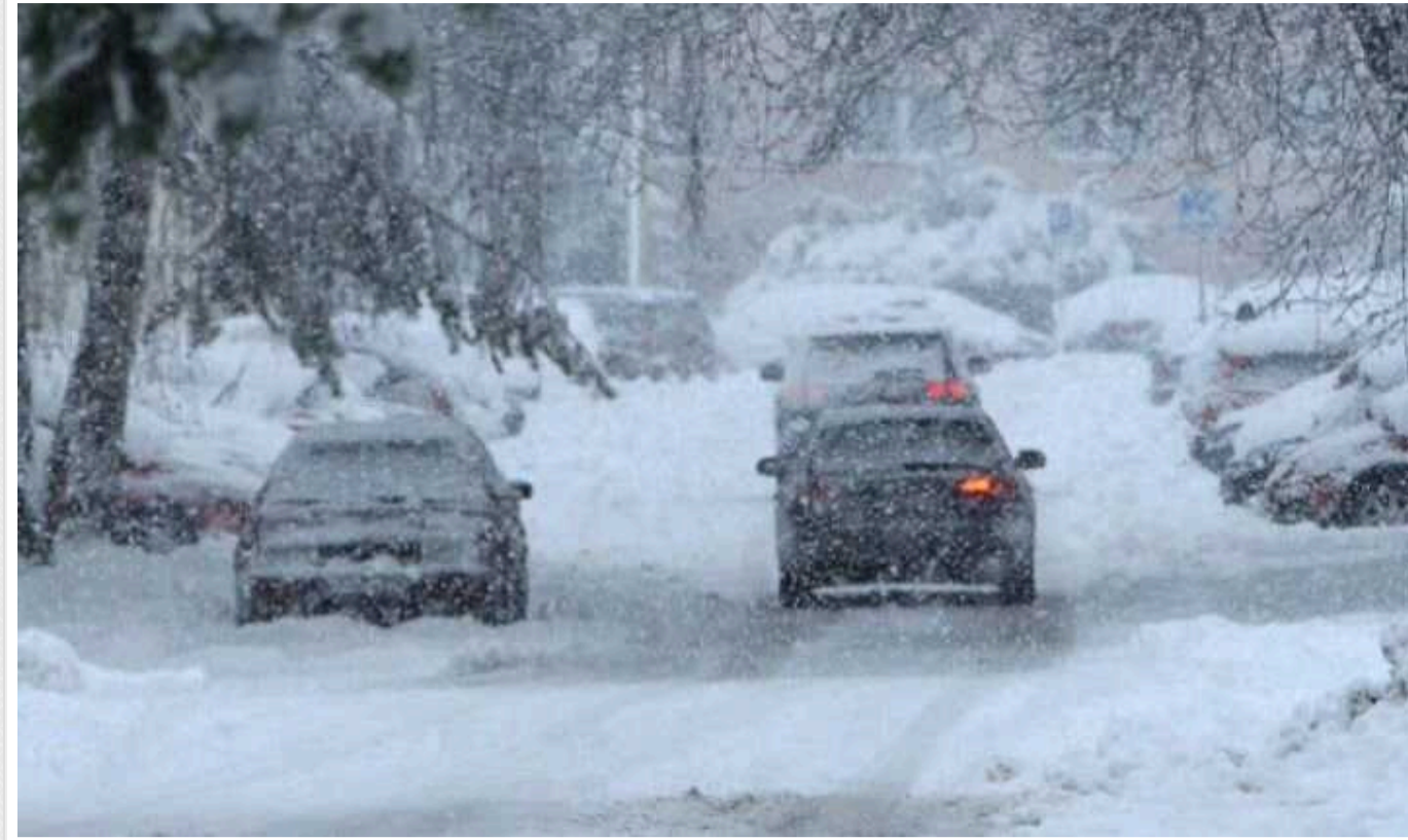
Негода в Україні: водіїв попередили про можливі обмеження на низці трас

В Україні через негоду, яка очікується 7-9 січня, можуть обмежити рух на низці трас.