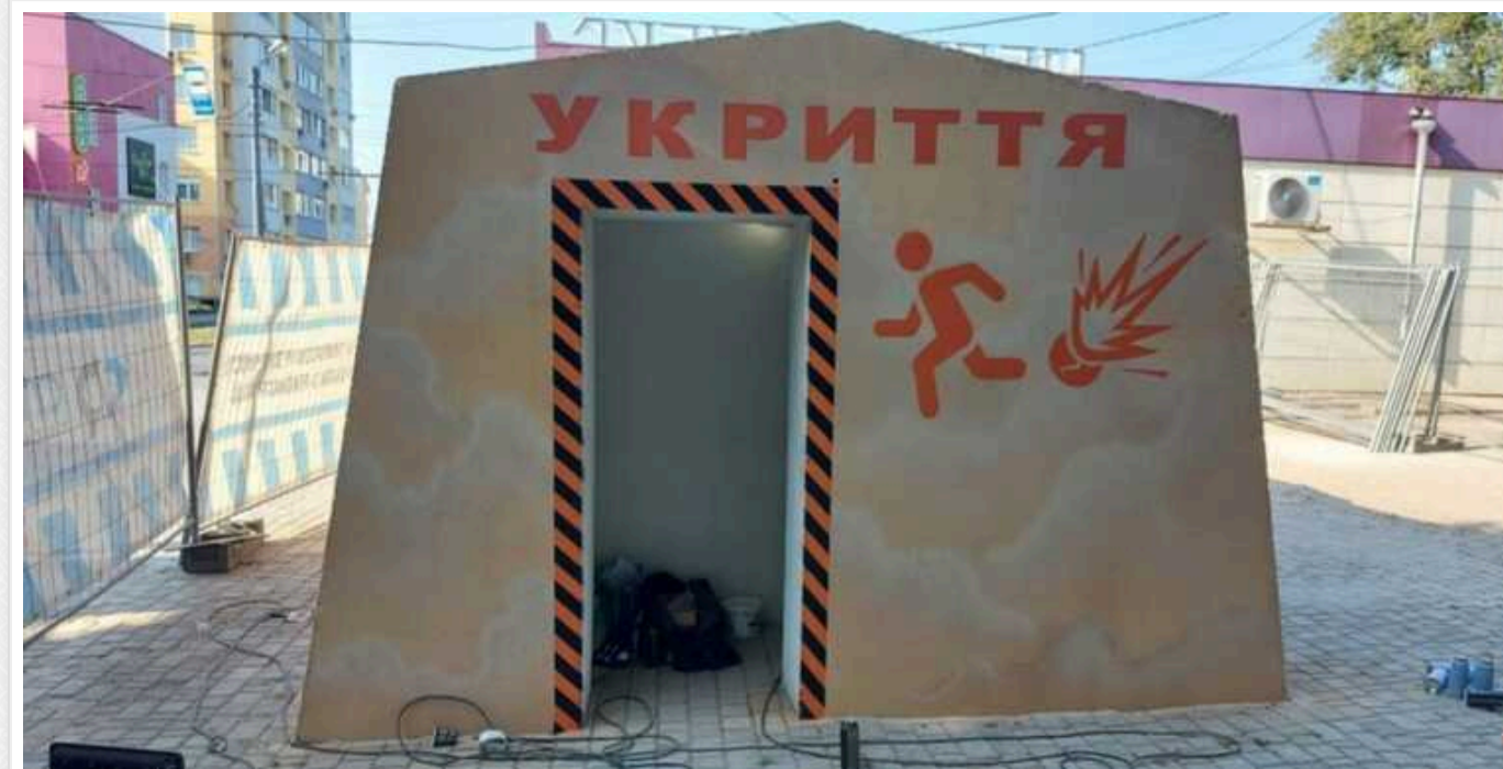
У Полтаві директор лікарні змовився з підприємцем, щоб заробити на ремонті укриття: чоловіків взяли під варту

Октябрський районний суд Полтави обрав запобіжний захід очільнику Глобинської міської лікарні та підприємцю, який займався ремонтом укриття в лікарні. Чоловіків взяли під варту з можливістю вийти під заставу. Правоохоронці вважають, що очільник лікарні просив у підприємця 10% від заробітку на ремонті укриття в обмін на перемогу в тендері, на що останній погодився.