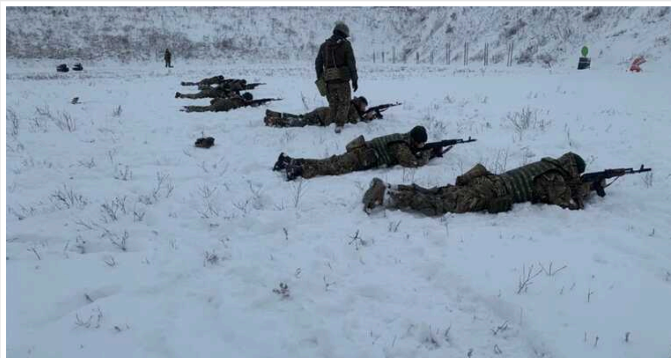
Легион "Свобода Росії" поповнився новими бійцями

Російські добровольці розповіли, що новобранці проходять навчання протягом 2-3 місяців. Там їх навчають витривалості, вогневої підготовки, інженерної справи та військової медицини.