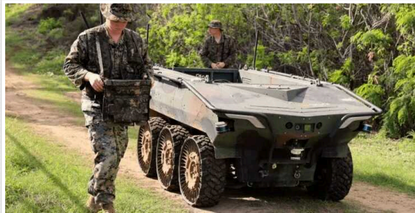
У США випробували двотонний безпілотник для військових: автоматично відстежує ціль

Arion-SMET може перевозити важке обладнання, працювати в різних режимах і бути оснащеним зброєю.