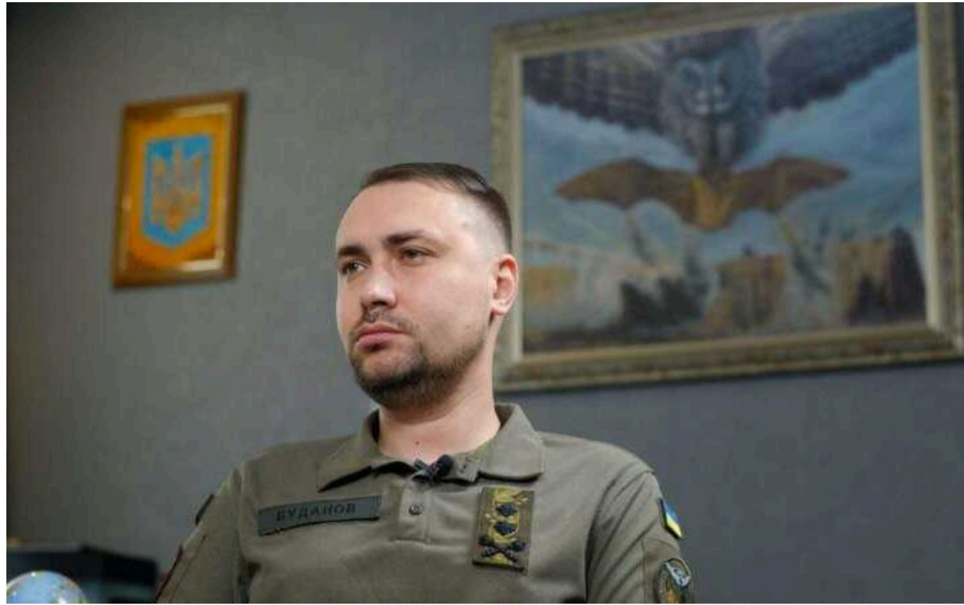
Буданов прокоментував рейд ГУР у Білгородській області: один із поранених росіян – знакова особа

У ході проведення операції українських розвідників на території Білгородської області (РФ) живій силі противника вдалося завдати вбитих і поранених втрат. Зокрема, один із тяжко поранених був "знаковою особою".