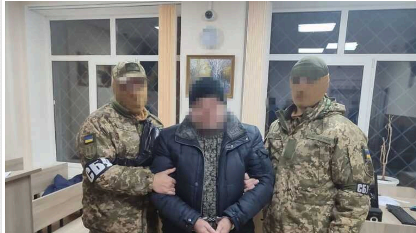
У Полтаві СБУ затримала "політексперта"-зрадника, який готував замовні статті для російських інтернет-видань

Служба безпеки затримала у Полтаві агента служби зовнішньої розвідки рф, який проводив інформаційні диверсії проти України.