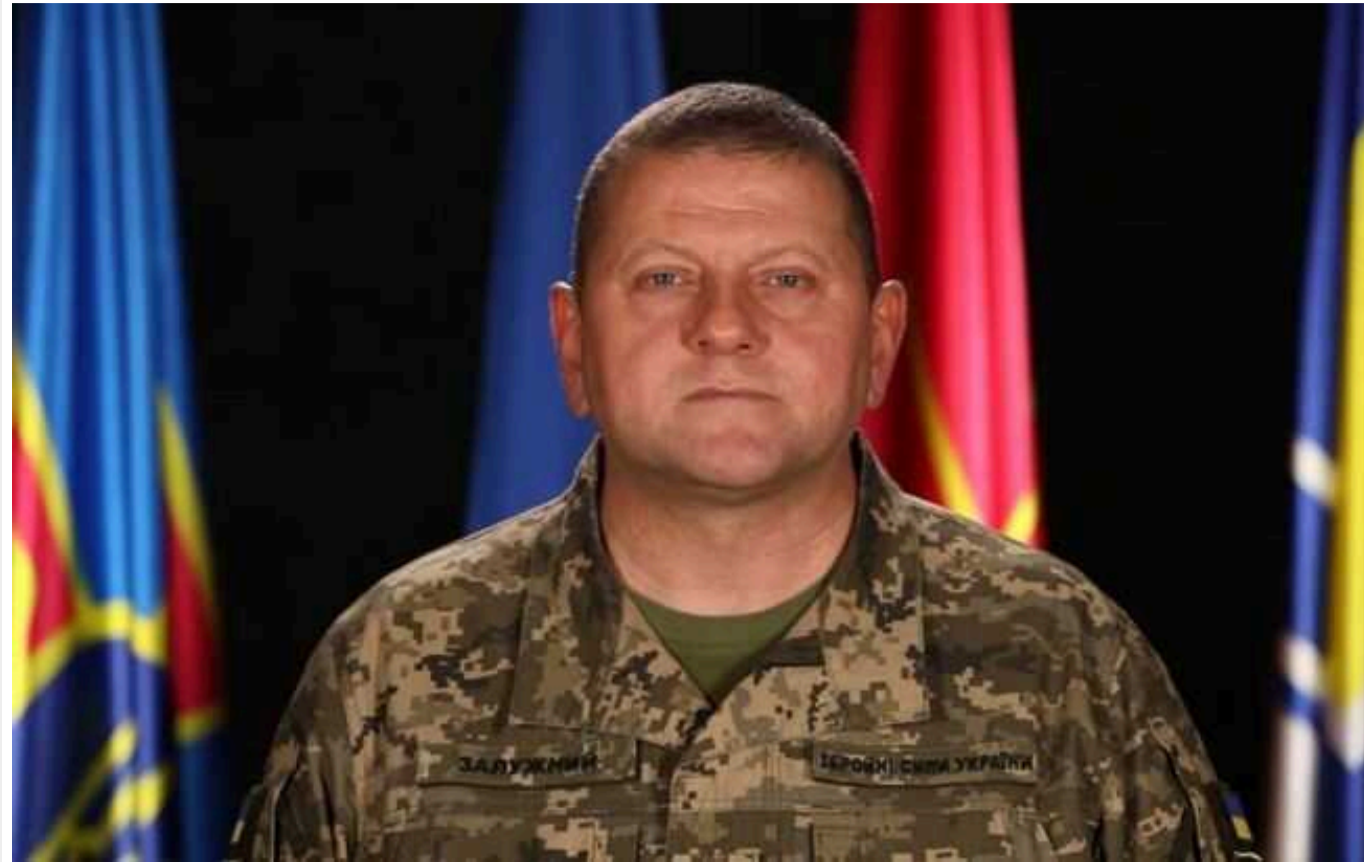
Залужний обговорив із командувачем ЗС США ситуацію на фронті

Головнокомандувач ЗСУ Валерій Залужний провів телефонну розмову з Верховним головнокомандувачем Об'єднаних збройних сил НАТО в Європі, командувачем ЗС США в Європі генералом Крістофером Каволі.