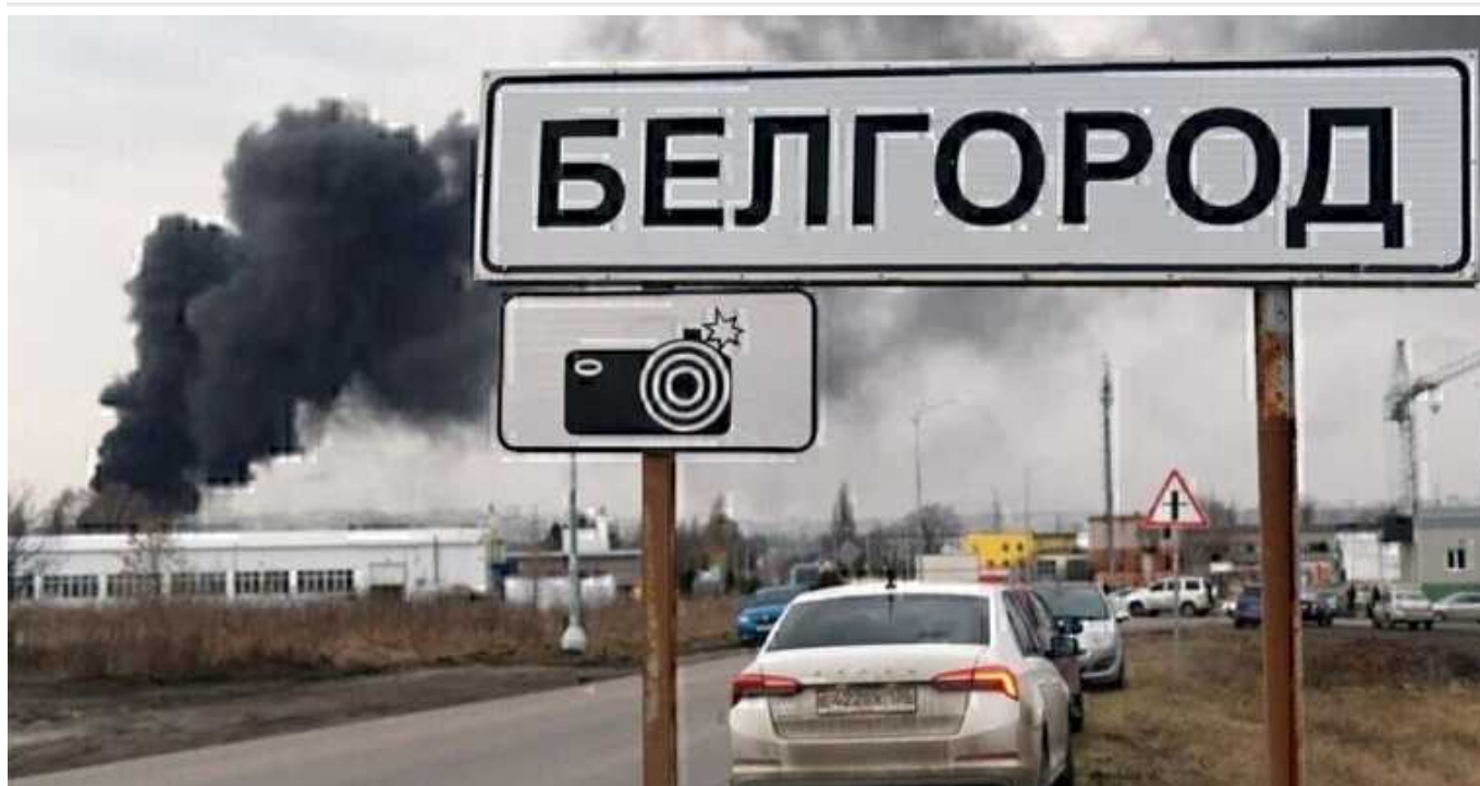
Жителям російського Белгорода влада пропонує евакуюватися: "Ситуація залишається непростою"

Губернатор Белгородської області РФ В'ячеслав Гладков звернувся до жителів цього російського регіону з закликом. Він порадив росіянам евакуюватися подалі від "обстрілів мирних кварталів" облцентру.