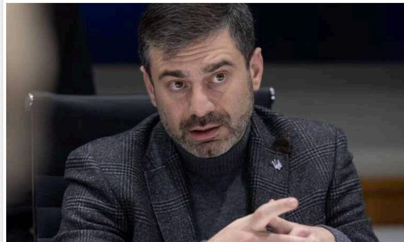
Лубинець відреагував на рішення Путіна надавати українським дітям громадянство РФ

Російський диктатор Володимир Путін підписав указ про надання українським дітям громадянства Росії. В Україні вважається одним із видів геноциду.