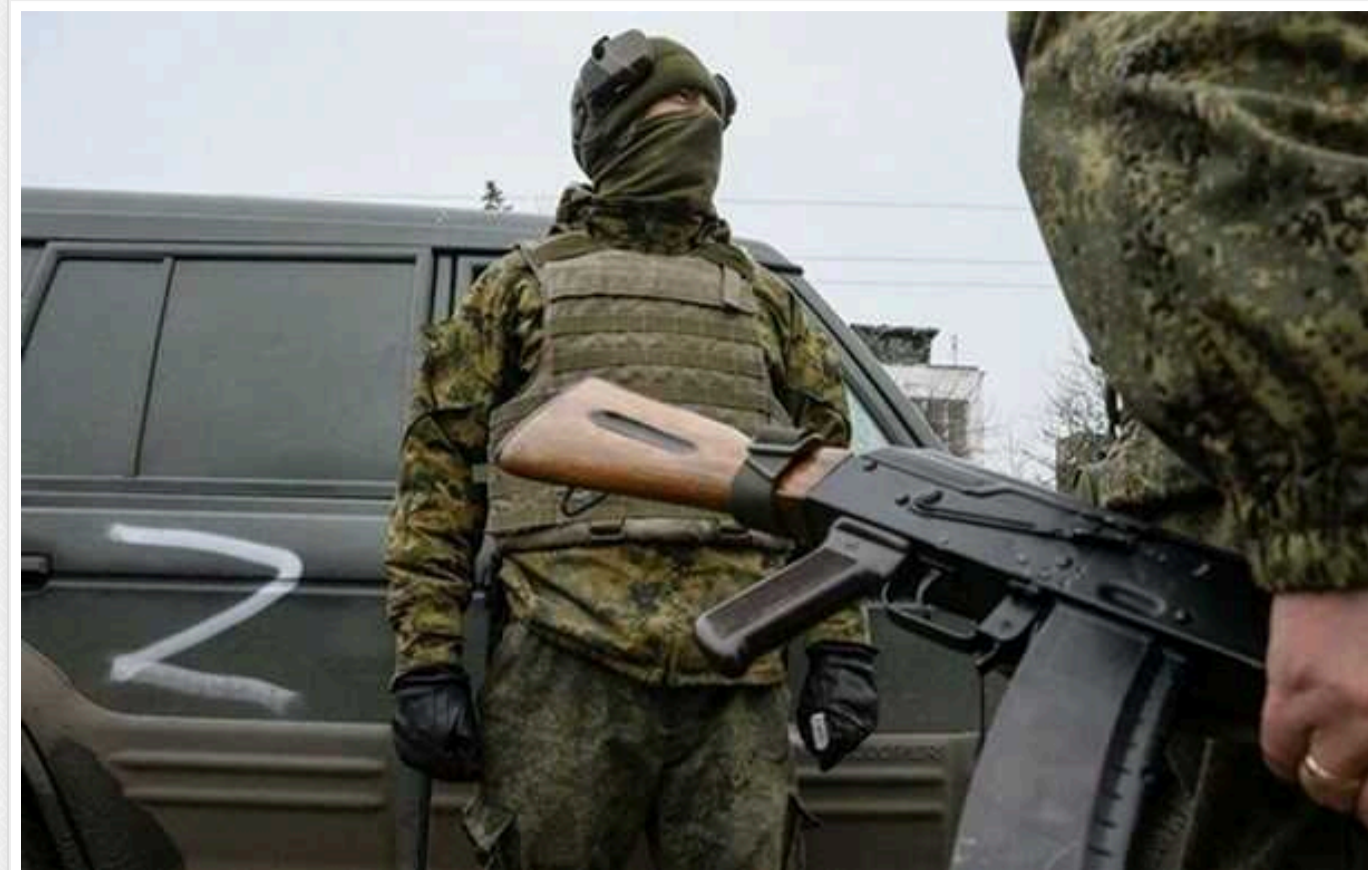
В окупованій Горлівці чергова "трагедія": зменшили години продажу спиртних напоїв