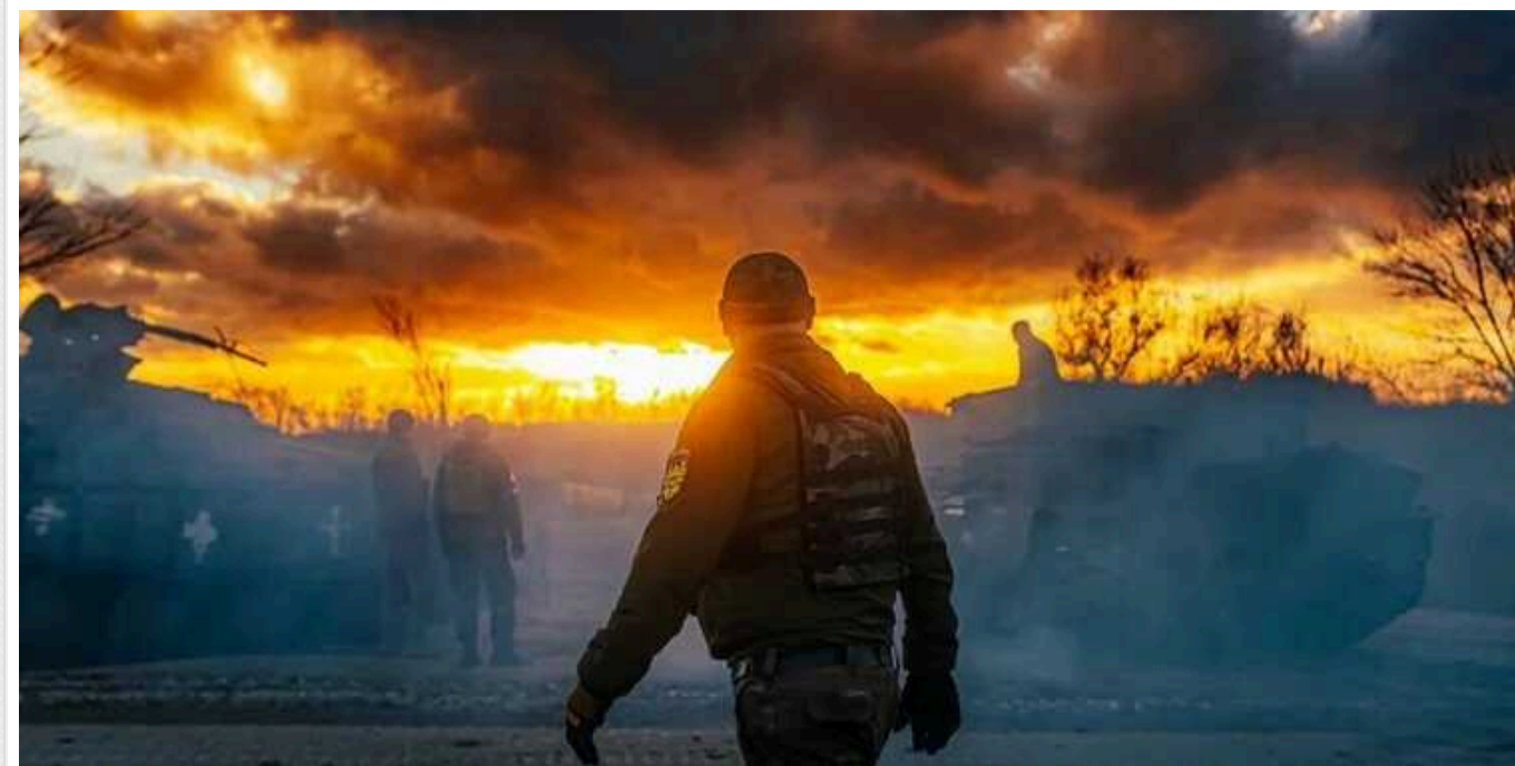
Інтенсивні бої в районі Кринок: британська розвідка описала ситуацію, Мадяр показав відео

Швидше за все, повітрянодесантним військам РФ на півдні України вдалося витіснити Сили оборони України з плацдарму на лівобережжі Херсонщини в районі села Кринки.