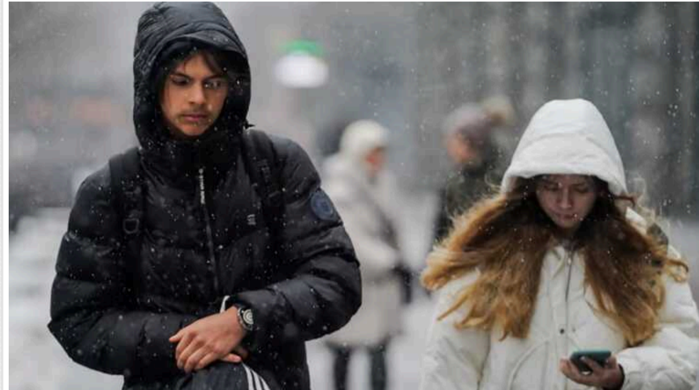
Синоптики попередили про різку зміну погоди: йдуть серйозні морози

Вперше у 2024 році погода покаже свій зимовий настрій. Так, 6 січня прогнозується відносно тепла та суха погода, а ось уже 7 січня варто очікувати на морози, вночі місяцями до мінус 15-17 градусів. Також посиляться вітер, придуть снігопади та дощі з мокрим снігом.