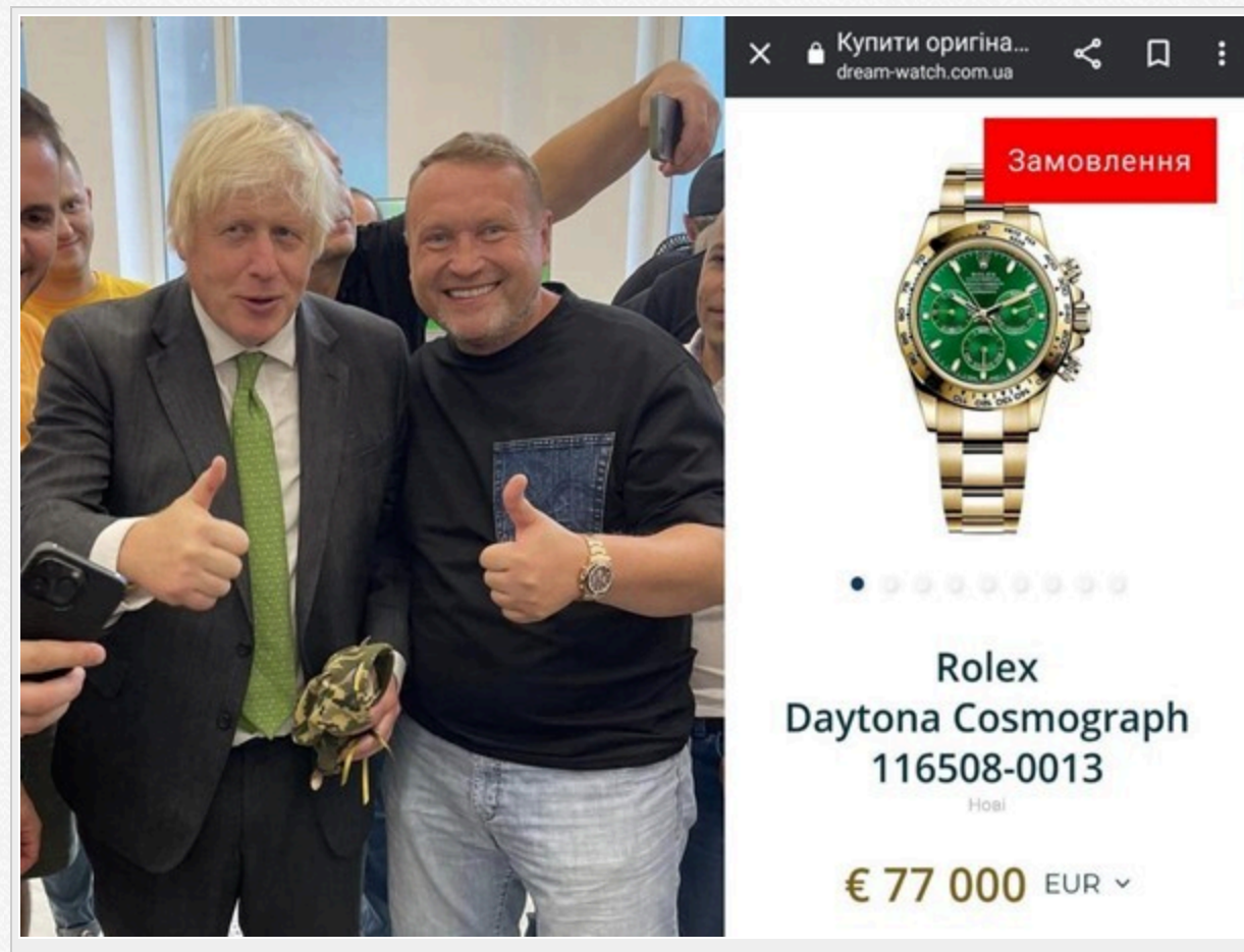
Фото Гринкевича та прем'єра Британії Джонсона – ілюстрація того, як прориваючись до перших осіб світу для фото колективний «Гринкевич» руйнує репутацію України.

Для мене – це така сама схема, як з одягом, але МО поки не поспішає розривати цю токсичну для них угоду.