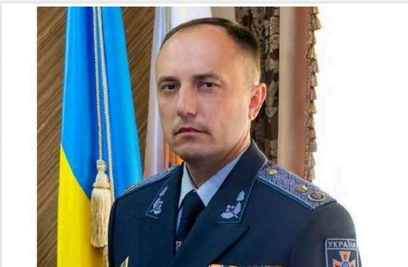
Розслідування НАБУ щодо корупції екскерівника ДСНС Сергія Крука: що відомо на сьогодні

У серпні 2022 року, за пік року від початку повномасштабного вторгнення, Державна служба України з надзвичайних ситуацій, якою на той час керував рівнянин Сергій Крук, вирішила придбати за 1 мільярд 370 мільйонів гривень спеціальну техніку.