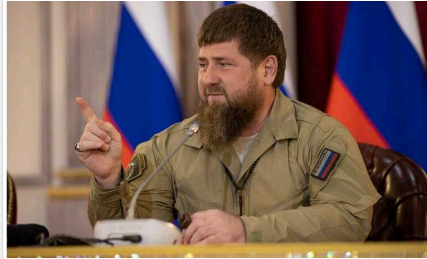
Кадиров запропонував США зняти санкції зі своїх родичів в обмін на українських полонених

Глава Чечні Рамзан Кадиров запропонував США зняти санкції з його родичів, коней та літака в обмін на українських полонених. Він заявив, що передає список полонених колишньому американському розвіднику, причіпнику Кремля та засудженому за сексуальні злочини Скотту Ріттеру, який прибув до Грозного напередодні.