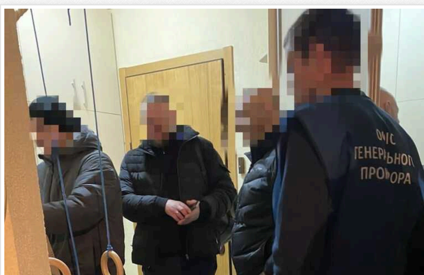
Заступнику голови Федерації профспілок повідомлено про підозру: за 150 тисяч доларів США намагався вийти з-під варті

За процесуального керівництва прокурорів Офісу Генерального прокурора заступнику голови Федерації профспілок України та його спільнику повідомлено про підозру за фактом закінченого замаху на надання неправомірної вигоди (ч. 2 ст. 15, ч. 3, 5 ст. 27, ч. 2 ст. 28, ч. 3 ст. 369 КК України).