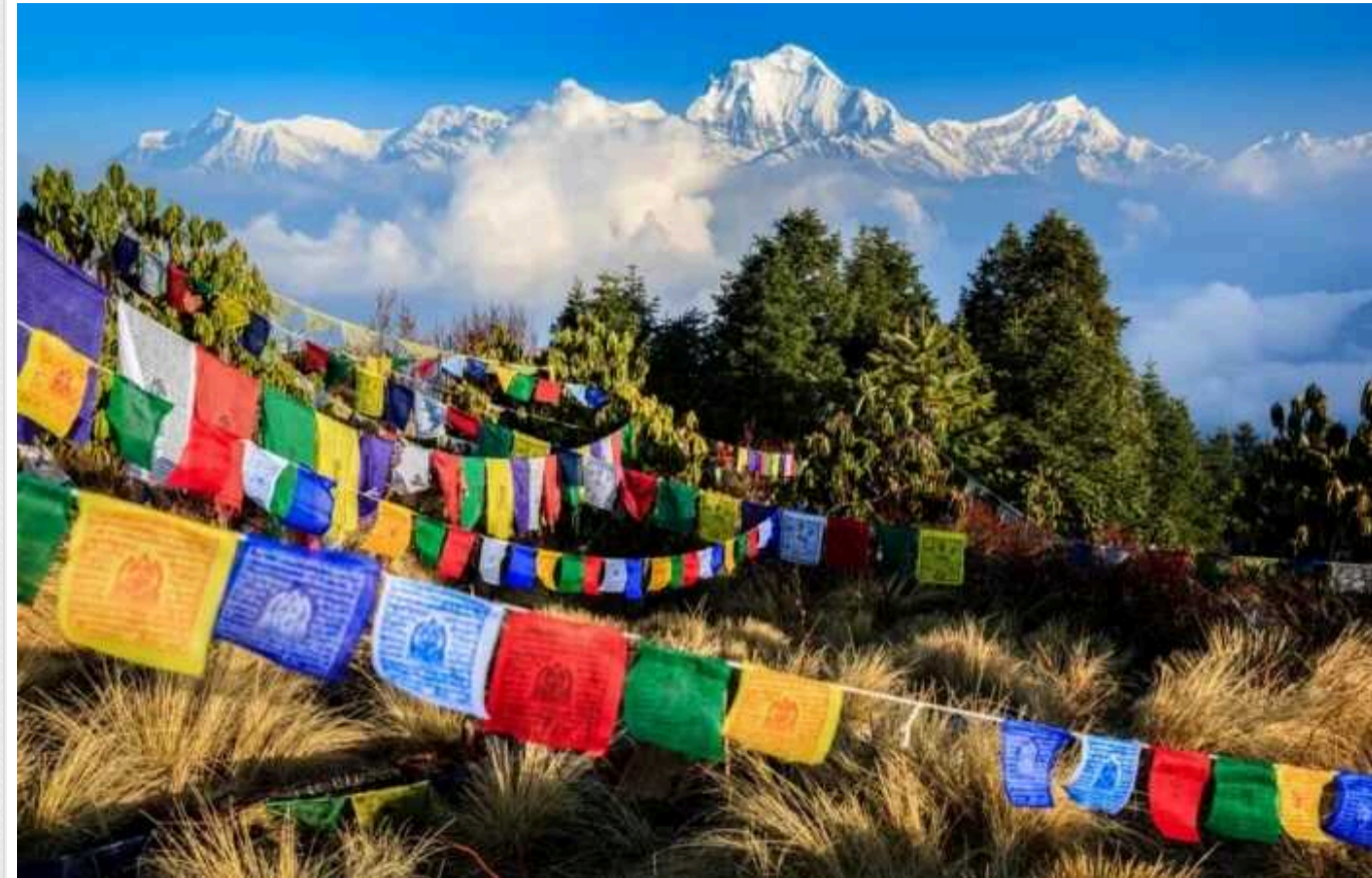
Непал припинив видавати робочі візи до Росії через вербування на війну

Непал припинив видачу дозволів своїм громадянам на роботу в Росії та Україні. Щонайменше 10 непальських солдатів було вбито під час служби в російській армії.