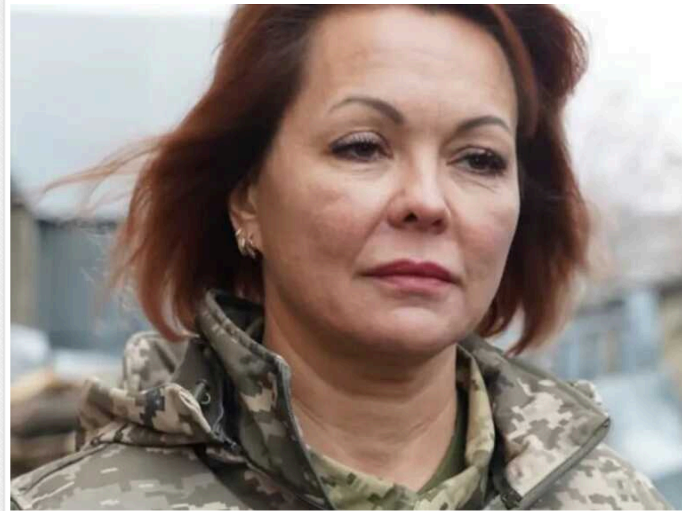
Армія РФ на лівобережжі Дніпра поновила використання бронетехніки, – Гуменюк

Російські загарбники поновили застосування бронетехніки на лівобережжі Дніпра, хоча раніше вони на ній економили.