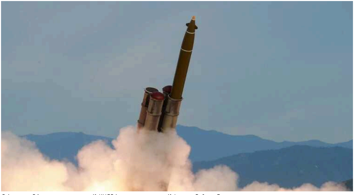
Які ракети РФ могла отримати від КНДР і може отримати від Ірану, – Defense Express

Хоча тема постачання балістичних ракет РФ від КНДР та Ірану впливає вже не вперше, але дійсно існує небезпечний сценарій, коли ворог таким чином буде поповнювати (і, ймовірно, вже поповнює) свої запаси далекобійного озброєння для терористичних обстрілів України.